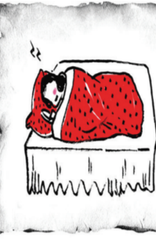
最省钱的美容方是睡觉