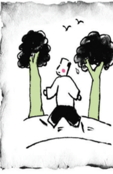
最简单的养生法是走路