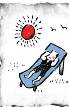
最好的药物是阳光