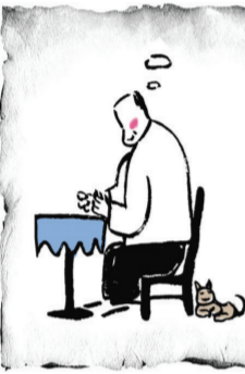
最好的医生是自己