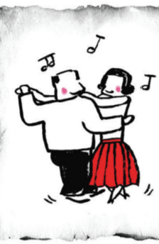
最好的长寿法是好心态