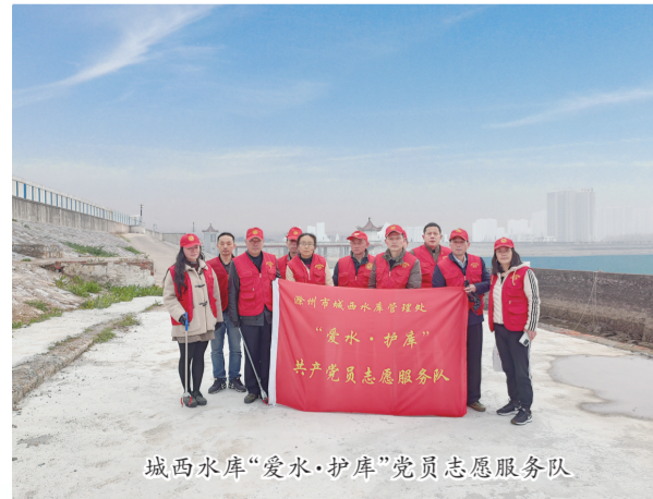
城西水库“爱水·护库”党员志愿服务队

为爱护水资源，保护环境，保护饮用水源地，3月15日，城西水库管理处“爱水·护库”共产党员志愿服务队来到城西水库库区开展志愿服务活动。党员志愿者们发扬不怕脏、不怕累精神，手拿垃圾钳、扫帚、打捞网和塑料袋等环卫工具，对水库坝顶、坝坡垃圾和水面杂物进行了拾捡和打捞，使得水库大坝及附近库区被打扫得焕然一新。