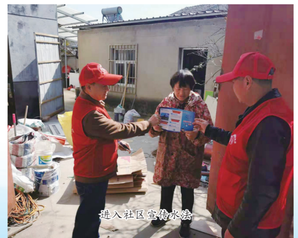
进入社区宣传水法

营造创建氛围。通过电子LED显示屏、微博、微信、短信、报纸、电视广播等平台宣传文明创建工作。利用单位新时代文明实践中心，开展思想道德宣传活动，引导干部职工传递正能量，广泛宣传创建文明城市知识，引导市民对创建文明城市知晓率、支持率、参与率。三年来，共制作更换文明宣传专栏61个，悬挂横幅32条，制作发放文明公约、文明餐桌、使用公筷、文明旅游、文明交通等宣传单页1000多张。