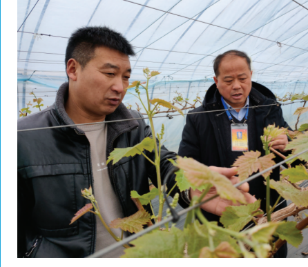
明东街道大力发展特色农业,在抹山、魏岗、唐郢等村种植阳光玫瑰等优良葡萄品种200余亩。