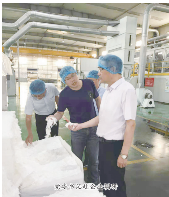
党委书记赴企业调研

自2008年3月10日设立以来，徽商银行滁州分行始终紧紧围绕滁州市委市政府的决策部署，着力提升金融服务实体经济能力，扎根助力滁州市地方经济发展，立足亭城，惠泽乡里，全力践行“贾道儒行，以人为本”的理念，充分依托覆盖城乡的网络优势，逐步构建起普惠、多元、完善的金融服务体系，为全市经济高质量发展作出了积极贡献。