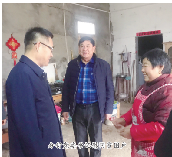
分党委书记慰问贫困户

近年来，徽商银行滁州分行始终坚持以党建工作为引领，持续延伸金融扶贫触角，切实提高站位，全面执行脱贫攻坚工作要求，建立防止因疫因汛返贫监测和帮扶机制，定期深入村部，走访慰问帮扶贫困户家庭，及时掌握贫困户情况，详细了解他们的家庭生活状况，因地制宜地申请扶贫专项资金，精准支持贫困地区个人脱贫致富，切实为贫困户办实事、解难题，累计帮扶34户贫困