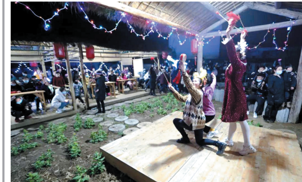
近日,凤阳县小岗村新春灯会文化艺术节期间,近万名游客纷沓而来,络绎不绝,点亮小岗乡村夜游模式。本次活动的成功举办,为抗击疫情,重启旅游经济增添一道亮丽风景线,也是小岗对乡村夜游模式的积极探索。(凤融)

功人士到乡镇举办家政服务、种植、养殖、物流配送及园林花卉、服装加工等技能培训,使全乡600余名群众接受技能培训。依托政策扶持,提高创业能力。该乡利用淮河行蓄洪区安全建设之机,落实创业小额贷款政策,发放10至50万元不等的小额贴息贷款,引导群众从当地资源优势、自身特长出发,选择投资少,见效快、效益高的项目,帮助有创业能力和的群众实现创业梦想,强化示范带动。为加快群众创业致富步伐,采取做给群众看,带动群众干的方式,着重在物流配送、农产品加工、电子商务、特色养殖等方面发掘致富典型,通过榜样示范,带动周边群众主动加入创业增收队伍。(葛晓军)