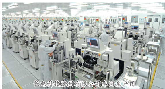
长电科技滁州有限公司车间生产图

抓骨干企业培育,新增当年投产当年入规企业10户,亿元以上企业达到60户,产值占比94.7%,拉动规模以上产值15.9个百分点。