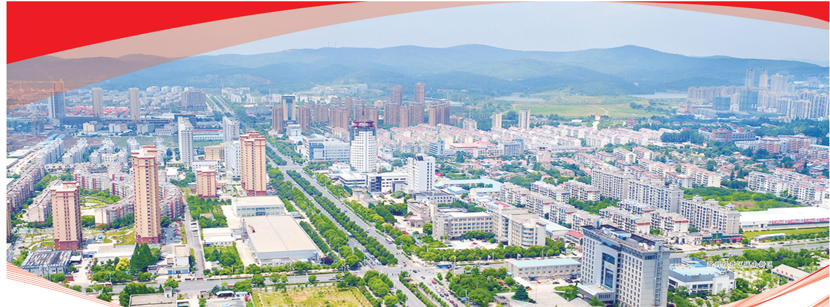
滁州经开区城南新区