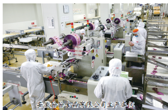
安徽瑞德食品洁公司生产现场

效项目腾退和闲置用地盘活。截至目前,完成低效企业腾退处置8家,新嫁接项目6个,盘活闲置用地近千亩。