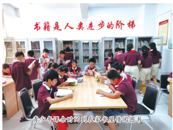
青少年课余时间到农家书屋借书阅读

家书屋等惠民文化活动。坚持每村每年1部戏、每季1次读书活动、每月1部电影，累计送戏下乡5890场，放映农村公益电影6.458万场，举办各类读书活动2万余场，广播发送疫情防控知识、防汛抗旱信息以及娱乐节目等14万余条。推进文化“扶智扶志”，开展农技讲座等活动1500多场次，覆盖全市123个贫困村。连续5年开展民生杯文化站调演45场；举办惠民文化消费季活动，推动优质出版物全民共享；举办“出彩滁州人”演出季活动6届120余场，线上线下参与450多万人次，该项活动已经成为全市人气最旺、规模最大、持续时间最长、辐射范围最广的一个大型文化品牌。