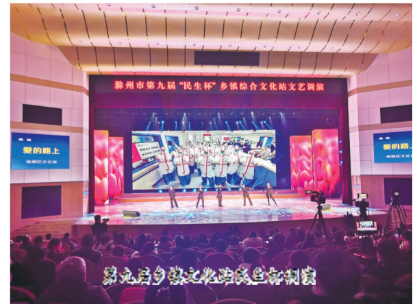
滁州市第九届“民生杯”乡镇综合文化站文艺汇演

对外交流丰富多彩。“十三五”以来，共有180余家文旅企业、220种文旅产品走近国内国际大型展会、商贸等文旅交流推介活动，30余种文旅产品获得国家行业大奖。持续推动长三角一体化向纵深发展，面向合肥、南京两大都市圈及高铁沿线城市举办推介会等专题活动50余场。主题活动推陈出新。精心策划主题突出、形式多样、内容丰富的文旅推介活动，推出琅琊山庙会、正月十六走太平、桃文化旅游节等多个影响力大、覆盖面广的文旅活动，举办千秋剥枣节、年货节、网红采风踩线、5·19旅游日主题活动等20多类2000多场次文旅宣传推广活动，运用直播、VR、AR等线上渠道开展“云游滁州”“扶贫赶集”等特色推广活动。宣传矩阵初步形成。先后开通滁州文旅抖音、微博、微信、头条号，主打新媒体，携手全国领先的旅游攻略平台“马蜂窝”、休闲旅游平台“同程旅游”等OTA服务商，共同打造集游、住、吃、购于一体的“一码游滁州”旗舰店。2020年，FM105.4“滁州交通音乐广播”频率正式升级为“滁州旅游交通广播”，全面融入文旅元素和服务功能，实现广播与文旅跨界联合，靶向定位600万长三角自驾人群，累计策划200期文旅专题节目，每日播出时长240分钟以上。