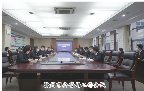
滁州市公管局工作会议

着力解决营商环境“最后一公里”问题。对标苏州和省内先进市,编制《优化招投标领域营商环境“双对标”工作方案》,出台《招标投标提升行动方案升级版》《政府采购提升方案升级版》,公开招标限额以下政府采购项目免收投标保证金,取消政府采购服务类项目履约保证金,鼓励采购人免收所有政府采购项目履约保证金