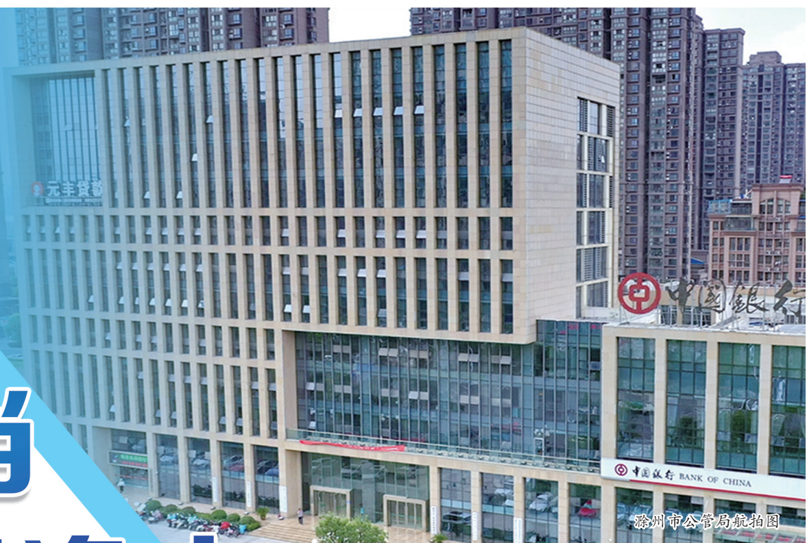
滁州市公管局航拍图