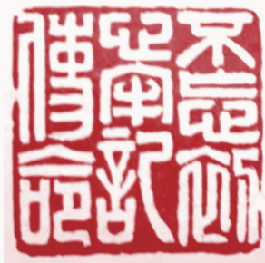
不忘初心 牢记使命