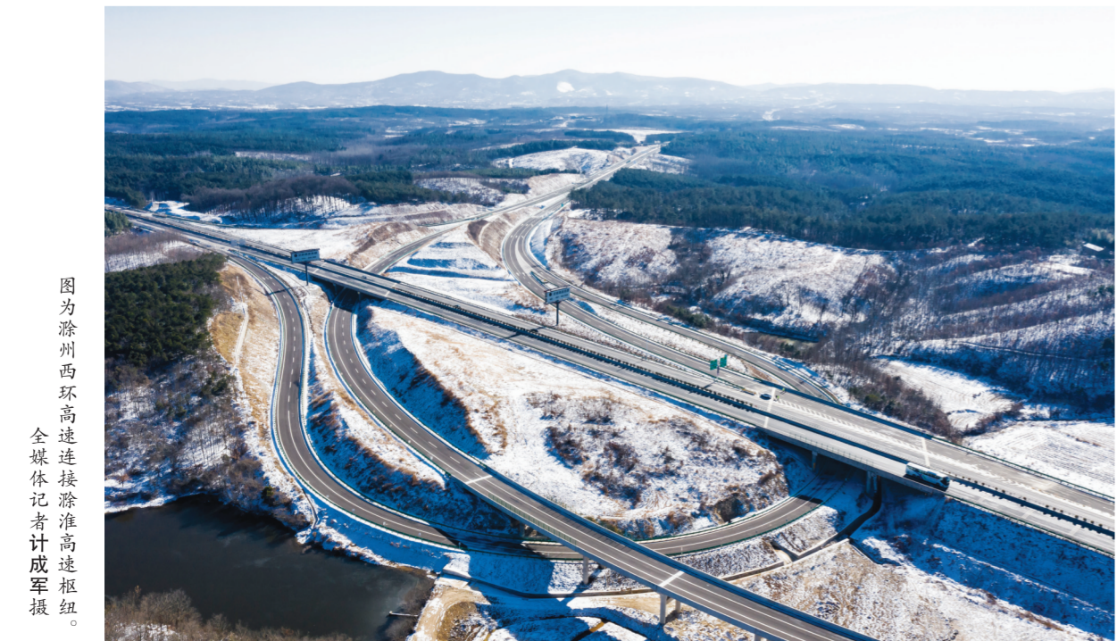
图为滁州西环高速连接滁淮高速枢纽。