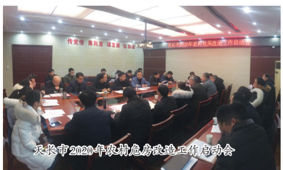
天长市2020年农村危房改造工作启动会

五年来,经过天长市人不遗余力的努力,天长市的老旧小区改造成效明显,农村危房改造扎实推进,农村生活垃圾治理和污水处理工作进展顺利,城市面貌和居民环境得到很大改善,群众满意度持续提升。