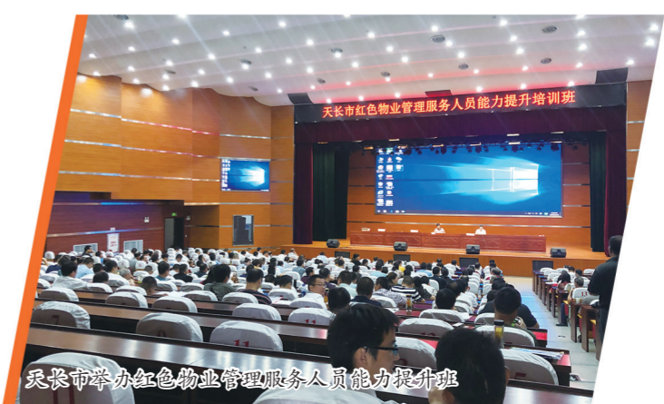
天长市举办红色物业管理服务人员能力提升班

漫步于天长市的大街小巷,一步一景,城市的细节越来越饱满。只争朝夕,不负韶华。今后,天长市住建局将持之以恒、久久为功,努力谱写城市建设更加出彩的新篇章。