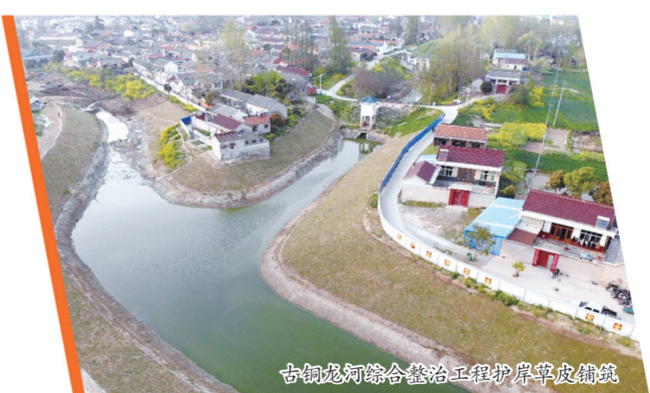
古铜龙河综合整治工程护岸草皮铺筑