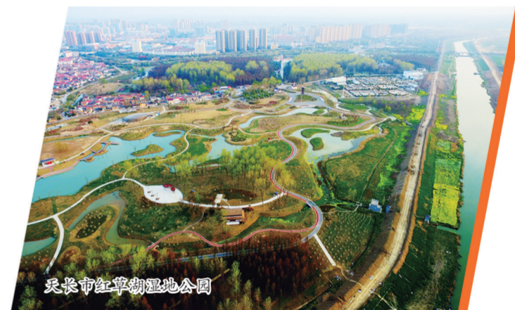
天长市红草湖湿地公园

加快绿色城市建设。编制完成《天长市城市园林绿地系统规划》,新建千秋大道等市区道路绿化,提升滨河公园以及老城区部分道路绿化。推动海绵城市建设,完成了合群渠环境整治三期工程,同步实施了沿公园、河道景观建设15公里长的绿道。推进“四河两渠”新白塔河综合整治工程。