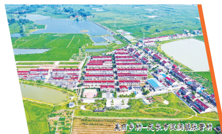
美丽乡村—天长市双坝镇双坝村