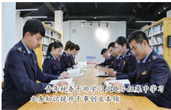
青年税务干部学习兴趣小组集中学习业务知识提升干事创业本领

政策落地快。密切关注减税降费政策动向，对分批出台的优惠政策，及时研究政策规定、解读、细化配套征管措施，编印支持疫情防控、复工复产、就业创业、防汛救灾等政策指引10余种；同步调整征管软件系统，保证政策出台即能便捷享受。辅导培训快。推进线上包保，一户一策、分级包保、责任到人、包保到企，向4.5万户企业累计线上推送政策8.53万余次，开展电话辅导2.01万次，推送电子宣传资料9.96万份。享受过程快。加快推进税收优惠政策备案，由纳税人自行判断、自行申报、自行享受；简化办税环节、简便操作程序、精简报送资料，业务办理时长平均压缩20%以上；加快电子税务局建设，企业90%以上涉税业务可通过网上办理，移动办、掌上办渠道更丰富。诉求响应快。为有诉求企业，持续推送减税降费明细账，提供经营管理、财务核算建议，为企业算清账、算好账；建立纳税人诉求问题快速响应机制，坚持即时答、即时办原则，收