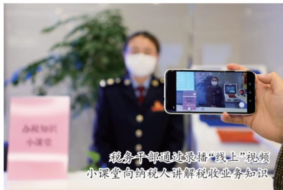
税务干部通过直播“线上”视频小课堂向纳税人讲解税收业务知识

推进“非接触式”办税。按照尽可能“网上办”的原则，依托电子税务局、手机APP、邮寄等“非接触式”办税方式，拓展网上办理覆盖面，网上发票发售占比83.20%，邮寄发票9584单。对纳税人、扣缴义务人通过电子税务局申报，因财务报表等附报资料暂时无法提供的实行承诺制“容缺办”。同时，做好预约错峰申报安排，努力实现均衡有序申报，确保纳税人安全、高效、便捷地完成各项涉税事项办理，共预约办理9110笔。加快纳税信用修复。坚持集体审议原则，规范补（复）评等动态调整处理流程，对160户企业进行纳税信用修复。通过纳税信用提醒系统，向纳税人精准推