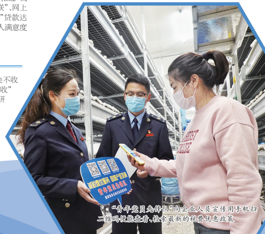
“青年党员先锋队”向企业人员宣传用手机扫二维码便能查看、检索最新的税费优惠政策

发挥税收大数据特别是增值税发票数据覆盖面广、及时性等优势，深化产业链供应链运行分析，帮助企业打通堵点、连通断点、畅通节点。深入开展税收分析，密切关注各行业开票销售走势等数据，形成高质量分析报告，通过对比分析和建言献策，为地方党委政府科学决策提供前瞻信息服务。优化税收执法方式。把推进“三项制度”作为规范税收执法行为的抓手，推广执法全过程记录制度，实现全过程留痕和可回溯管理，让权力以“看得见”的方式规范运行；全面推行重大执法决定法制审核制度，始终坚持把法制审核作为重大执法决定的“前置环节”，让权力经受得住“法治检验”；推行税收执法公示制度，以清单的形式明确公示范围、形式、依据和信息来源，确保执法信息公示规范统一。建立进户执法审批机制，规范税务人员进户执法行为，尽最大限度合并进户执法任务，切实做到“无风险不检查，无审批不进户”。