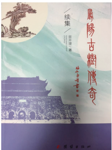
《凤阳古树传奇(续集)》官开理/著

中华民族是伟大的民族，在五千年悠久的历史长河中，创造了光照千秋、璀璨夺目的中华文明，留下了繁星般闪耀的历史遗产。古城、古村、古树、古建筑数不尽数，古树就是其中的代表之一。这些散落在全国各地山河湖畔、田间地头、街头巷尾的古树，凝聚着千百年来来的自然精华、历经岁月的洗礼、穿越时空的隔膜，是文化之脉、自然之体、生态之基、历史之源，具有重要的生活价值、历史价值、科学价值和艺术价值。