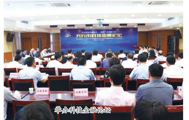
举办科技金融论坛

全市省级以上创新平台65家，院士工作站8家，省级企业技术中心29家，CNS检测实验室3家。规划投资10亿元总面积为12万平方米的天长人才科创城，为滁州市十大创新平台，2.8万平方米首期工程已建成使用，已入驻2家专业