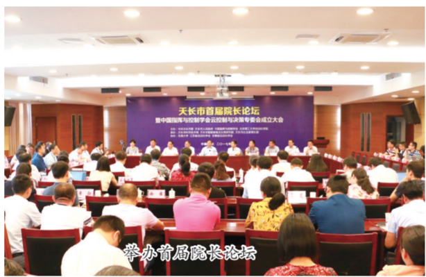
举办首届局长论坛

全市自主培养2家国家级、1家省级、2家滁州市级众创空间。市高新技术创业服务中心为全省县级唯一一家国家级科技企业孵化器，累计毕业企业160家。天长积极引育市外专业孵化器。2018年，与上海工程技术大学共建国家大学科技园天长园区，成功建设2000平方米“众创汇”众创空间。2019年，南京极客站孵化器在天长成立公司，已建成1200平方米的科技孵化器、长三角科技成果转化天长基地、众创咖啡；今年重庆市科学技术研究院西南高科(天长)人