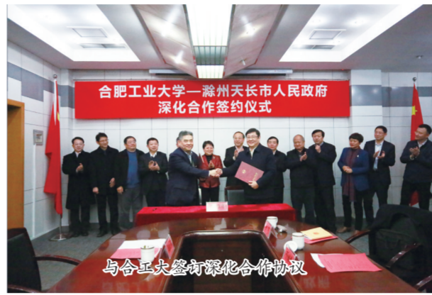
与合工大签署深化合作协议