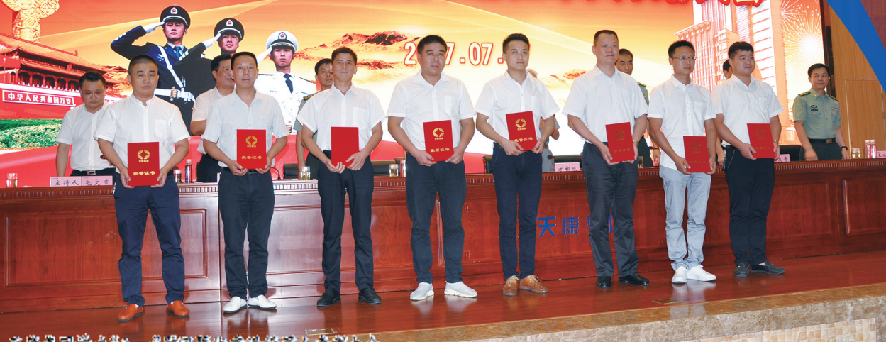
天康集团举办“八一”慰问暨优秀退伍军入表彰大会