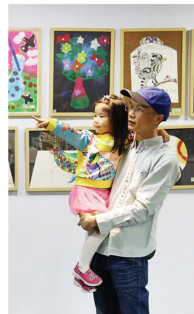
情境教学法、趣味教学法等多样化的教学方法,在实践中全方位地培养学生创造力和想象力。(伊美)

少儿美术教育并非单纯地让学生学习绘画技能,而要与音乐、文学、思想教育相结合,打破各学科之间封闭的状况,将学生置身于多元的情境中,从视觉、听觉、思想等方面全方位地培养学生的想象力和创造力。如,教师将古诗和绘画相结合,让学生根据诗词所描绘的场景,结合实际生活经验,积极调动创新思维,充分发挥想象力,创作美术作品。另外,将家庭教育、学校教育、生活教育结合,家庭的教育理念和良好艺术氛围对于学生的艺术敏感度、审美水平等具有深远的影响。在学生对于生活的感悟基础上,教师可以引导、鼓励学生利用生活中的一些废弃材料,充分发挥想象力进行美术创作。学校美术教育要打破学生对教师产生的依赖性,让学生养成自己动脑、动手的好习惯。另外,教师也要采取