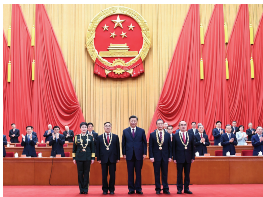
中共中央总书记、国家主席、中央军委主席习近平向“共和国勋章”获得者钟南山(前排右二)、“人民英雄”国家荣誉称号获得者张伯礼(前排左二)、张定宇(前排右一)、陈薇(前排左一)颁授勋章奖章。

经受了这场艰苦卓绝的历史大考,付出巨大努力,取得抗击新冠肺炎疫情斗争重大战略成果,创造了人类同疾病斗争史上又一个英勇壮举。习近平代表党中央、国务院和中央军委,向受到表彰的先进个人和先进集体,向为这次抗疫斗争作出重大贡献的广大医务工作者、疾控工作人员、人民解放军指战员、武警部队官兵、科技工作者、社区工作者、公安民警、应急救援人员、新闻工作者、企事业单位职工、工程建设者、下沉干部、志愿者以及广大人民群众,向各级党政机关和企事业单位广大党员、干部,致以崇高的敬意!向积极参与抗疫斗争的各民主党派、工商联和无党派人士、各人民团体以及社会各界,向踊跃提供援助的香港同胞、澳门同胞、台湾同胞以及海外华侨华人,表示衷心的感谢。