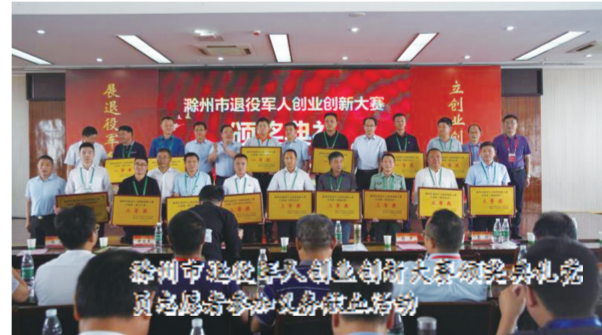
滁州市退役军人创新创业大赛颁奖仪式

创业需要原始资金,钱从哪里来?市退役军人事务局制定《滁州市拥军优抚合作协议》,联合7家银行推出优质、优惠金融服务方案,在天长市开展“军誉贷”创业贷款试点,为退役军人提供5万-200万元融资担保,累计发放贷款200余万元;在明光市开展“裕农通”退役军人创业服务站试点,为农村籍退役军人就业创业拓宽渠道。