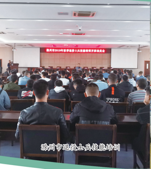
滁州市退役士兵技能提升培训