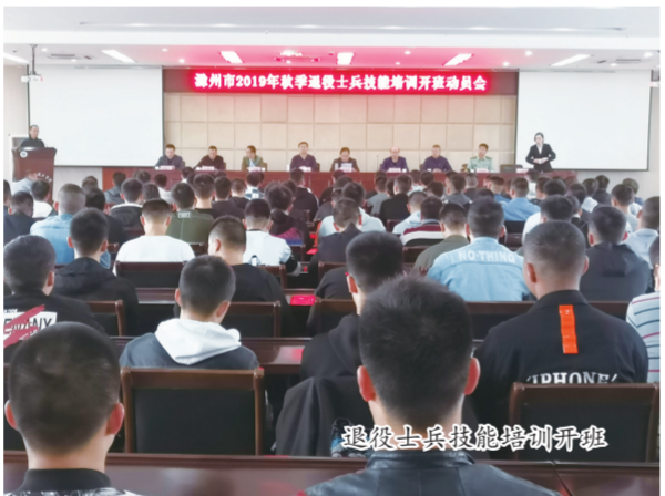
退役士兵技能提升培训开班

打造培训基地,提升素质助就业。我市是职业教育大市,立足皖东、面向“长三角”,着力打造“省内一流、国内知名、特色鲜明”的技能培训品牌。依托滁州职业技术学院和职业培训院校,招录退役军人,开展机电工程、土木工程、汽修工程等专业技能培训。2019年录取998名退役军人入读高职专科,开展针对性就业创业技能培训23批次,培训退役军人2651人,助力1800余名退役军人实现高质量就业。目前,已建立就业创业培训基地12家。