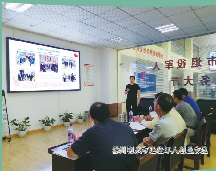
滁州市退役军人实训基地揭牌仪式