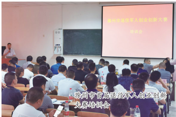
滁州市退役军人创新创业大赛培训会

党的十八大以来,习近平总书记对退役军人工作高度重视,强调“要做好高校毕业生、农民工、退役军人等重点群体就业工作”,李克强总理在今年的政府工作报告中明确提出,做好退役军人安置和就业保障。