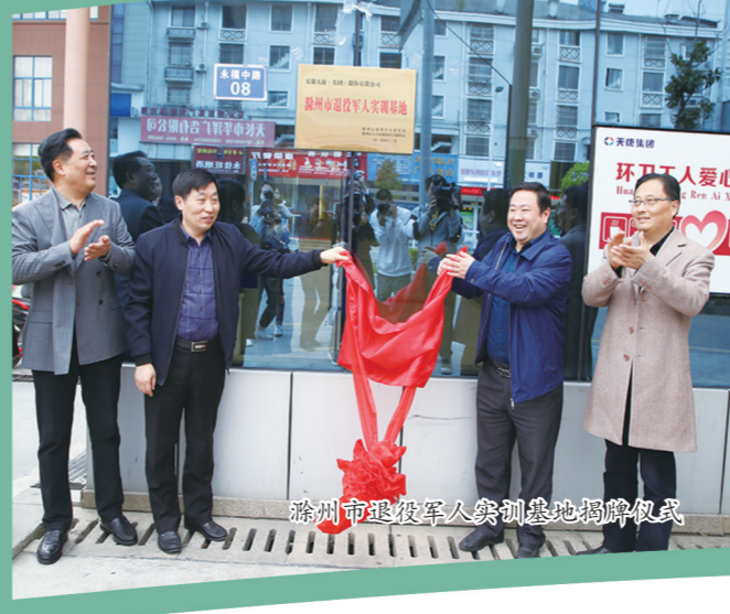
滁州市退役军人创新创业大赛颁奖仪式