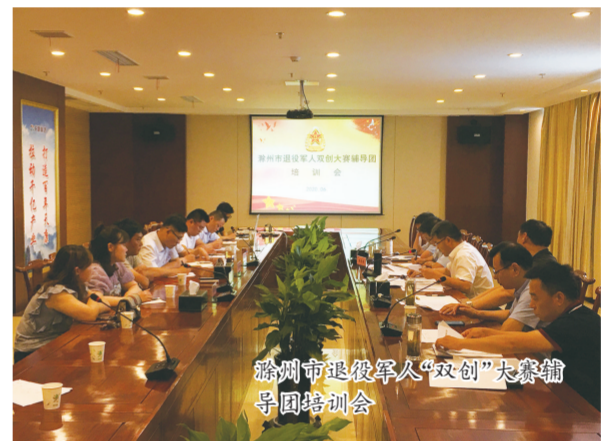
滁州市退役军人“双创”大赛辅导培训会议

“退役军人招聘专区”,对接省公共招聘网信息平台,实现省市县三级联动。今年以来,开展“送政策进军营”活动4场,为3410名驻滁官兵送上安置、就业创业等“政策大餐”,组织开展专题对话会7场,为179名退役军人零距离答疑解惑。