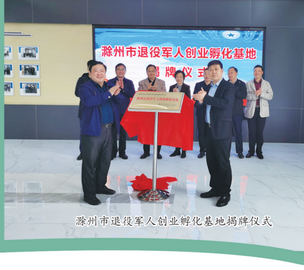
滁州市退役军人创业孵化基地揭牌仪式