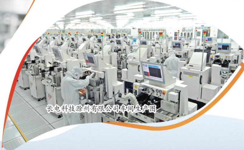
长电科技滁州有限公司车间生产图