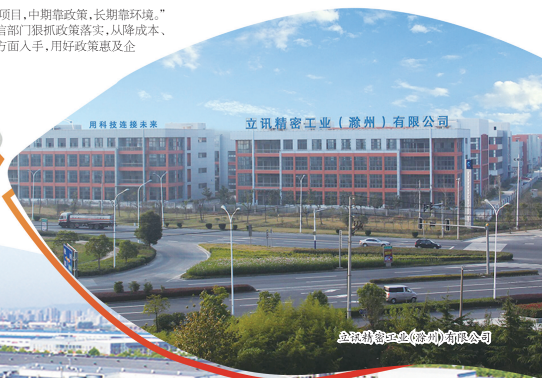
立讯精密工业（滁州）有限公司