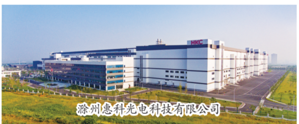
滁州惠科光电科技有限公司

政策出台只是开始，市经信部门在后续工作持续发力，只争朝夕、分秒必争，将政策“福利”变成企业获得感，确保一项项政策在掷地有声中“开花结果”。