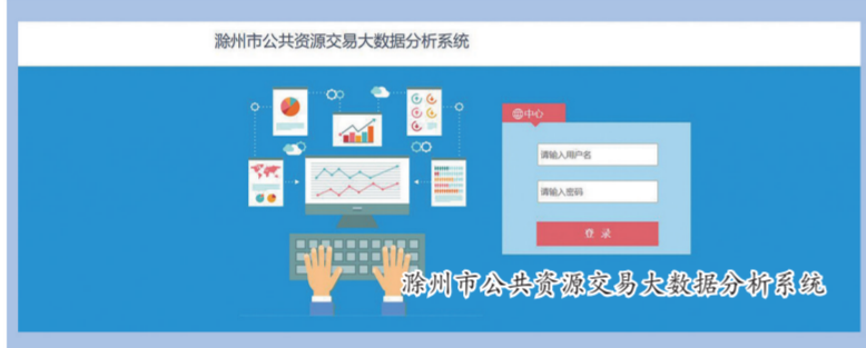
滁州市公共资源交易大数据分析系统