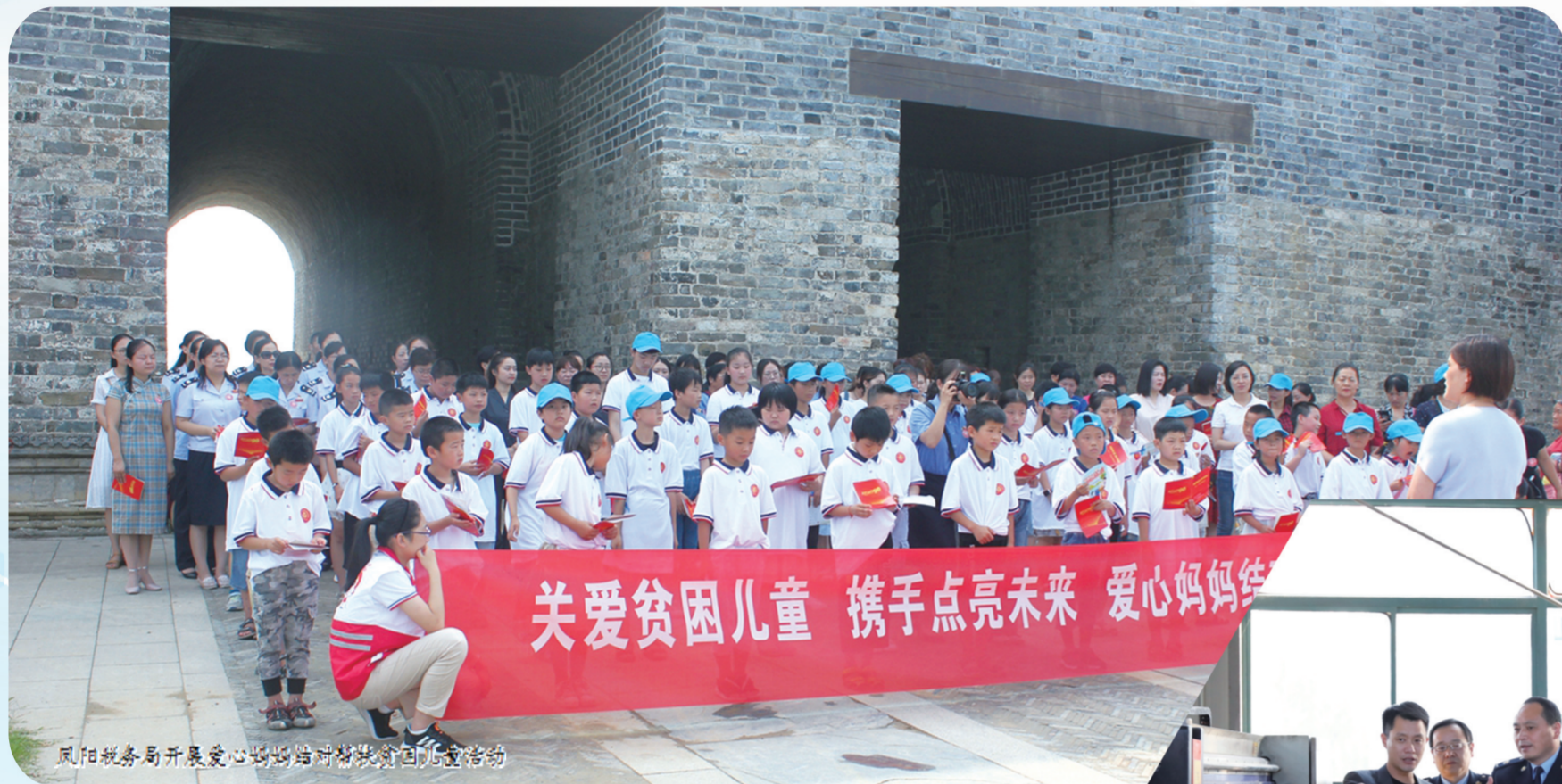
凤阳税务局开展爱心妈妈结对帮扶贫困儿童志愿服务活动

这是一支优秀的税收队伍，他们忠诚执着，依法治税；这是一个向上的集体，他们事争一流，勇攀高峰；这里又是一片文明的税海，他们崇德向善，文明有礼，真诚服务……这就是凤阳县税务局。