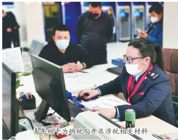
青年税干为纳税人开具涉税相关材料

同时，将原先34个单一功能窗口整合压缩为24个全能窗口，扩大自助办税区域，增加自助办税设备，并对多项业务进行流程再造，减少表单填写和资料报送，压缩不必要的流转环节，避免纳税人缴费人反复跑、多头跑，降低纳税和缴费成本，在确保办税和缴费顺畅便捷的同时，真正实现“一窗通办”。