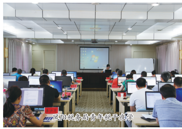
凤阳税务局青年税干夜校

为了确保创建工作顺利开展，该局成立文明创建工作领导小组，制定创建实施方案和监督考核机制，将创建的各项指标任务细化分解到各个分局、股室。同时，召开文明单位创建专题会议，将文明创建活动与税收征管工作同安排、同考核，做到创建活动与业务工作两不误、两促进，形成一把手亲自抓，分管领导全力抓，人人参与，齐抓共管的文明创建活动格局。