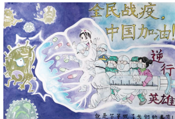
《重击》 靳海云/绘 定远县第一初级中学八(17)班