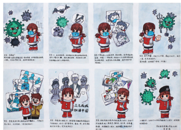
《战胜冠状病毒》 袁艺萌/绘 定远县花园湖小学五(2)班