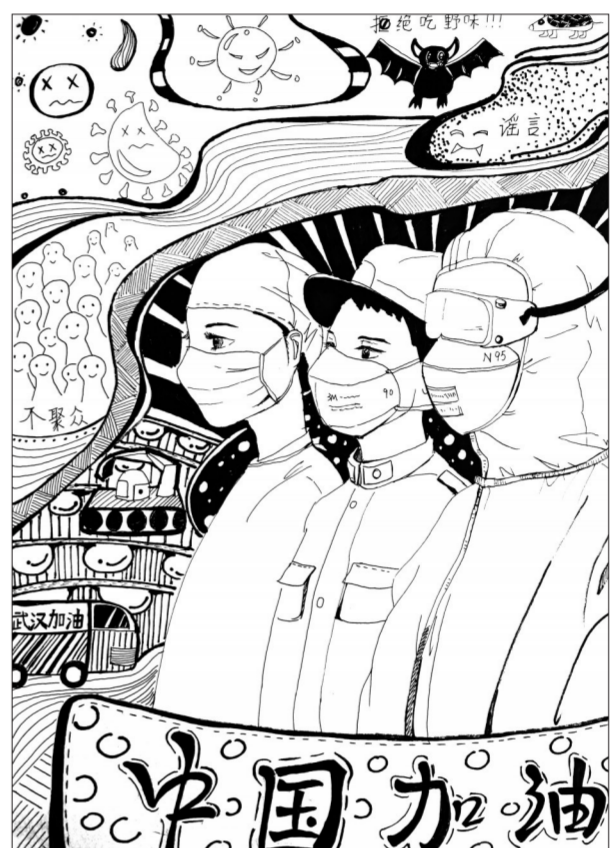
《你我同在》 陶冉/绘 定远县青洛初中七(4)班