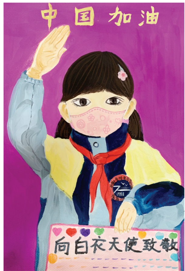
《感恩有你》 刘晓雅/绘 滁州市琅琊区紫薇小学二(8)班