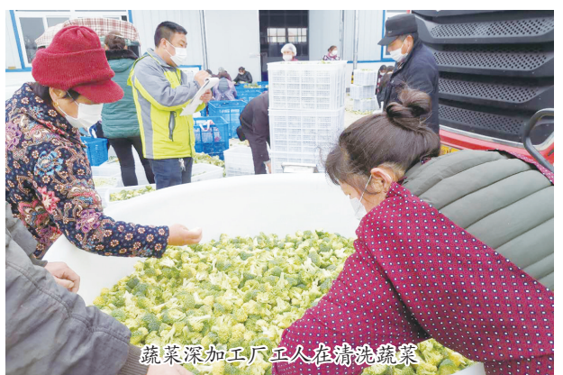
蔬菜深加工工厂工人在熟练处理蔬菜

在永林米业的生产车间里,机器轰鸣,工人戴着口罩有条不紊地忙碌在生产岗位上;在大陈村的蔬菜大棚里,妇女们兴高采烈地在家门口就业上班;在各村高标准农田改造施工现场,挖掘机来回穿梭忙个不停……时下,三和集镇统筹推进疫情防控和经济社会发展,全力保持经济平稳运行。