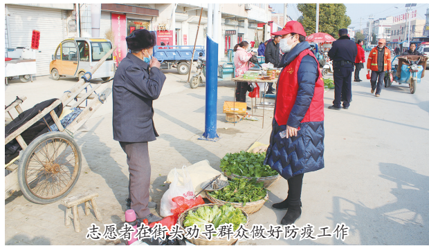
志愿者在街头劝导群众做好防疫工作

应对新冠肺炎疫情是一场前所未有的大考,首当其冲考的是各级党委政府和广大党员干部。