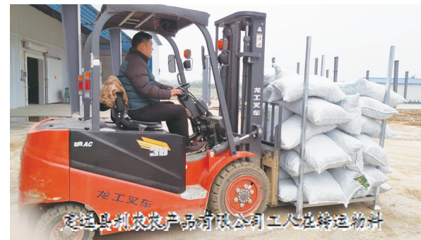
定远县制农产品有限公司工人在转运物资

成事为标准,打造了一支素质高、能力强、会发展的村干部队伍。其次,各村根据实际情况,因地制宜制定本村集体经济发展规划,认真谋划增收项目。