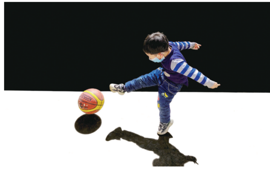
我的未来不是梦

天近晌午,我们家的“趣味汉字交流会”也圆满结束。女儿以最小的年纪拿到了最高的名次——第一名,让所有人刮目相看。大家都对这次的“趣味汉字交流会”意犹未尽,经我们全家人商量后决定:以后家里要定期举办这样的活动,还可以把同学、亲戚、邻居叫上,一起感受传统文化的魅力,把我们独特的汉语文化发扬光大!