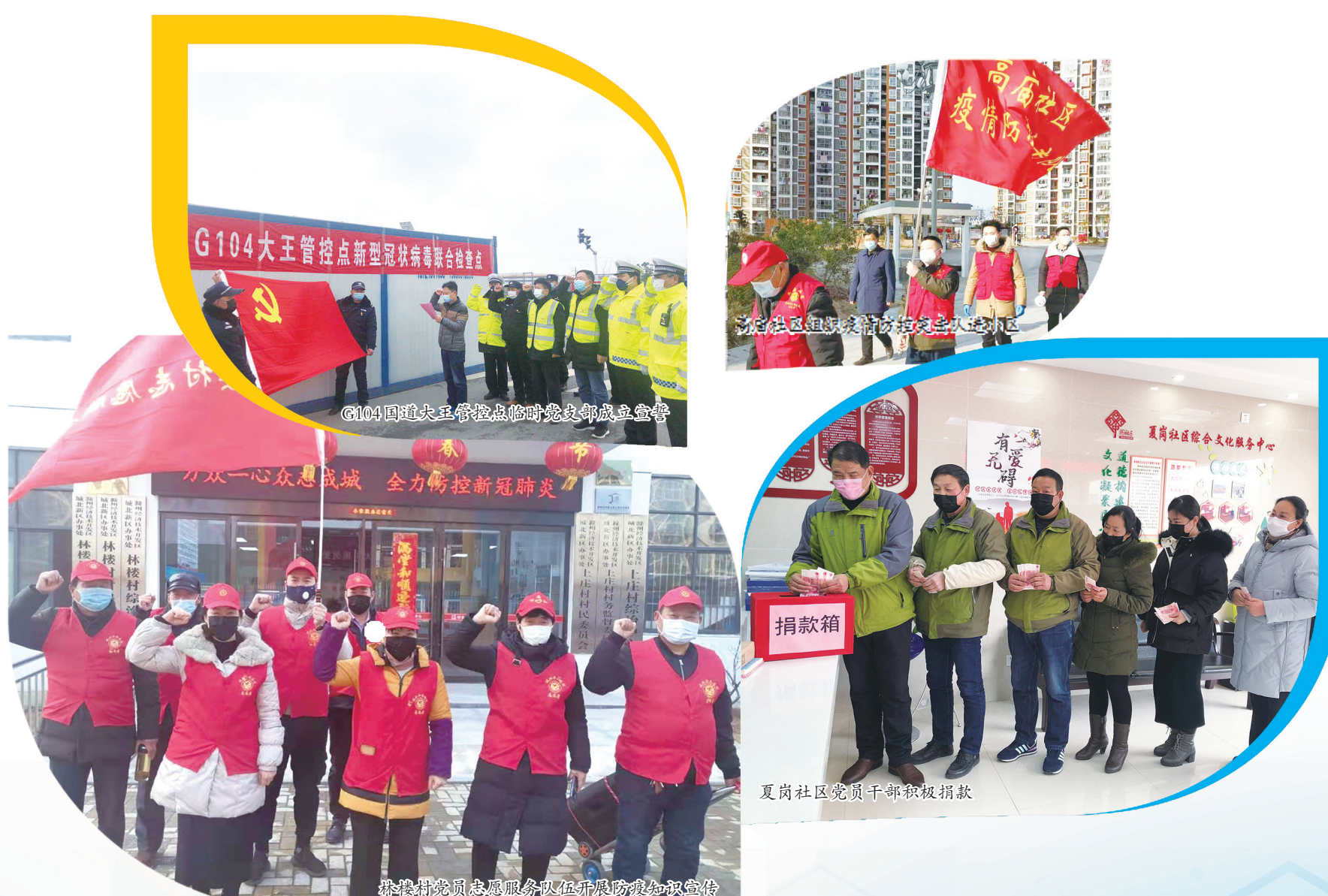
G104大王管控点新型冠状病毒肺炎联合检查点