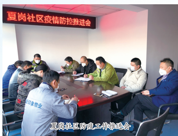
夏岗社区防疫工作推进会

2020年新春,突如其来的新冠肺炎疫情让全国上下投入到一场没有硝烟的战争。面对疫情,城北新区党工委深入贯彻落实中央、省、市、区疫情防控工作决策部署,全面落实严防严控措施,压紧压实主体责任,阻断疫情传播渠道,全力确保辖区群众生命健康和社会稳定。随着近期辖区企业陆续复工复产,给疫情防控工作带来新的挑战,城北新区党工委坚持防疫复工两手抓,奋力夺取疫情防控和复工复产“双胜利”。