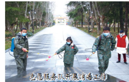
志愿服务队开展消毒工作

对于退役军人而言，越是攻坚克难，咬牙较劲的时候，越要冲锋在第一线，坚守好防控阵地。连日来，他们按照党委政府安排，冲锋在防控一线，或在城乡走访登记、或在路口劝返居家、或坚守本职岗位，用军人的担当守护着一方的百姓健康。