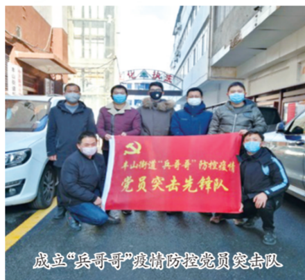
成立“兵哥哥”疫情防控党员突击队

疫情就是命令，防控就是责任。在疫情蔓延关键时刻，市退役军人事务局主动作为，沉入“疫”线，把疫情防控作为军人本色的“试金石”、能力建设的“练兵场”、党性修养的“大熔炉”，全力投入疫情防控工作。