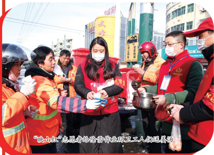
“映山红”志愿者给给管作业环卫工人配送物资

绿色戎装已卸，红色初心不改。截至目前，全市组建退役军人党员突击队、志愿服务队等549支，投入到防控宣传、排查登记、消毒清洁、卡口巡逻一线。发动退役军人和工作者以捐赠防疫物资、献血等方式支援疫情防控工作，共捐赠各类物资价值904128元。