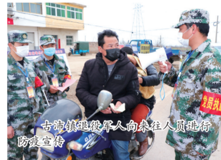
古沛镇退役军人向来往人员进行防疫宣传

…… 这些振聋发聩的誓言展现了新时代退役军人铁肩扛重担的责任与担当。这些只是一个缩影，还有许许多多的退役军人用实际行动抒写了“离军不离党、退役不褪色”的军人本色，彰显了乐善有恒、大爱无疆的人间真情。