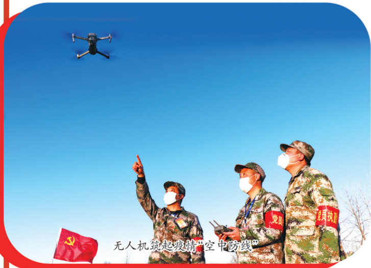
无人机起降疫情“空中防线”