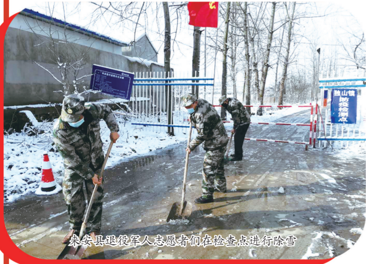
来安县退役军人志愿者们在检查点进行除雪