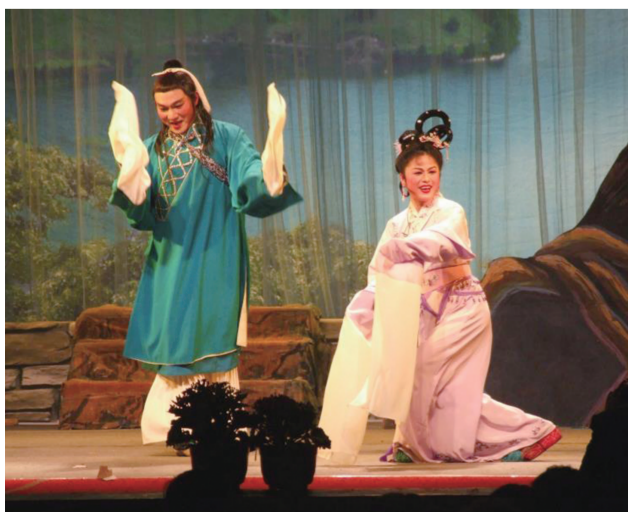
《天仙配》中扮演七仙女