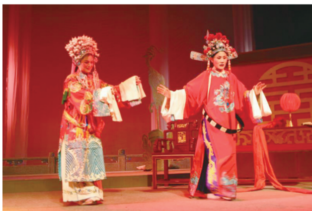
《女驸马》中扮演公主