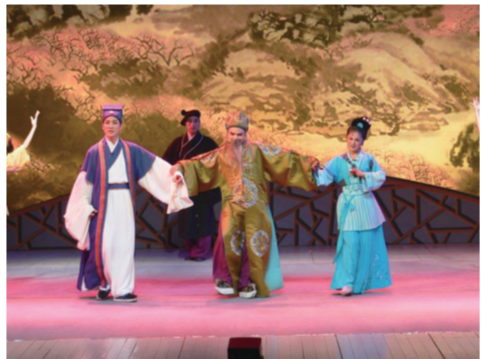
黄梅戏《借妻》中扮演妻子