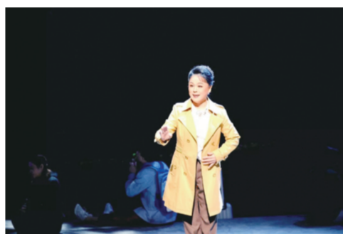
《一个都不能少》剧照

就有多大”。这几年,集团推出了《孝行天下》《走出阴霾迎霞光》《大明朱元璋之斩蟒》《一个都不能少》《抗大母亲》等系列原创剧。无论是在剧中扮演角色,还是负责组织协调,她总是一丝不苟。她常对年轻的演员们说:“我们演每一台戏,每一个角色都要带着责任心让观众满意,带着感恩的心不负组织上的重托和希望。”