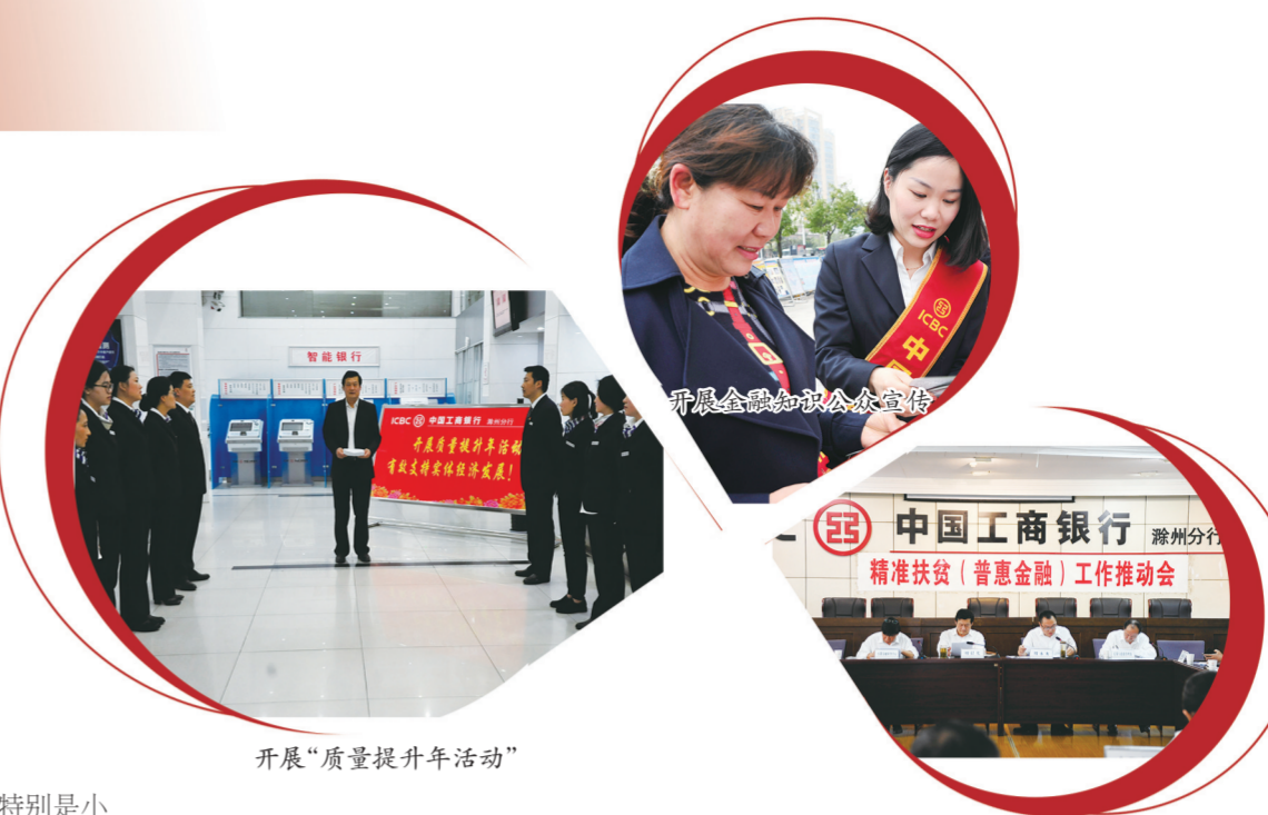
开展“质量提升年活动”

为让金融“血液”源源不断地流向小微企业，更好地服务广大中小企业，该行大力推广“开放式”平台融资服务，面向民营小微企业的“网贷通”“经营快贷”“e抵快贷”等产品全部实现线上办理，产品一经推出，深受市场青睐。截至2019年末，网上小额贷款贷款64户，贷款余额5574万元；经营快贷贷款100户，贷款余额1971万元；e抵快贷业务提款客户110户，提款余额6113万元。此外，该行坚决落实各项监管政策，严格