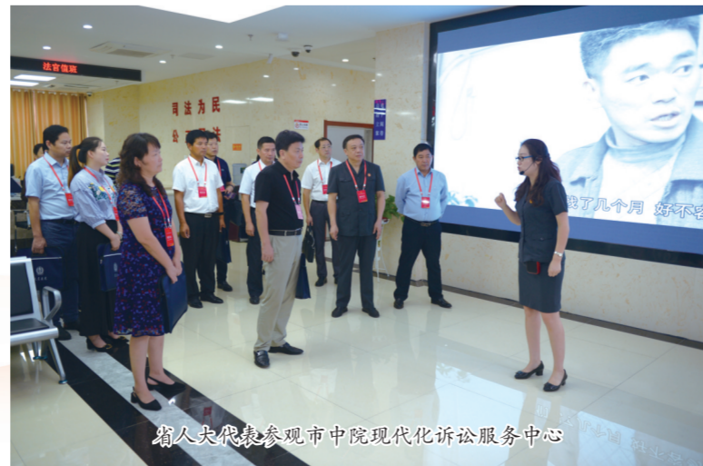
省人大代表参观市中院现代化诉讼服务中心

2019年，市中院积极探索推进长三角地区司法协作交流，为滁州实施“对接大江北”战略，加快融入长三角区域一体化发展提供强有力的司法服务和保障。积极推进跨区域立案，市中院办理了全省首例执行案件跨区域立案；全市两级法院同步设立长三角地区跨区域立案专门窗口，明确专人负责跨区域立案服务，对接“中国移动微法院”平台，通过数据交换与共享，实现就近提交、协助移送、异地办理、本地签收的“一站式”便捷办理，整个立案过程仅需10分钟左右。去年9月以来，主办或协助长三角区域法院办理各类跨区域立案117件。目前已实现全国范围内跨区域立案全覆盖。