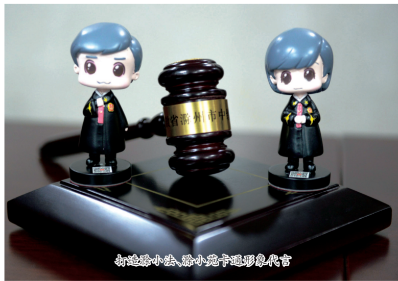
打造滁小法、滁小苑卡通形象代言

为认真贯彻落实党的十九届四中全会精神，按照习近平总书记关于“把非诉讼纠纷解决机制挺在前面”的要求，市中院不断深化矛盾纠纷多元化解机制建设，打造一站式纠纷专业调处平台，成立物业、道交一站式调处平台及类型化调处中心10余个，全市法院全部成立诉前和解中心。一年来处理各类纠纷25925件，调解13613件，委派调解率始终位居全省法院前列。加强行业专业性调解组织建设，推动成立商会调解中心，并在8个基层法院搭建商会一站式调解平台，特邀调解员60名，全年调解案件880件，调解成功率73%。2019年6月，安徽省商会人民调解工作会议在滁州召开，南谯法院作经验交流。拓展在线调解，利用新浪“在线法院”APP调解平台，提供在线咨询、在线调解、在线立案等服务。推进诉源治理，建立“法官1+1”“法官1+N”等模式，吸纳基层人民调解员1056名，小岗法庭指导建立小岗村义务调解委员会，全力打造小岗“无讼村”，为基层治理提供司法智慧。